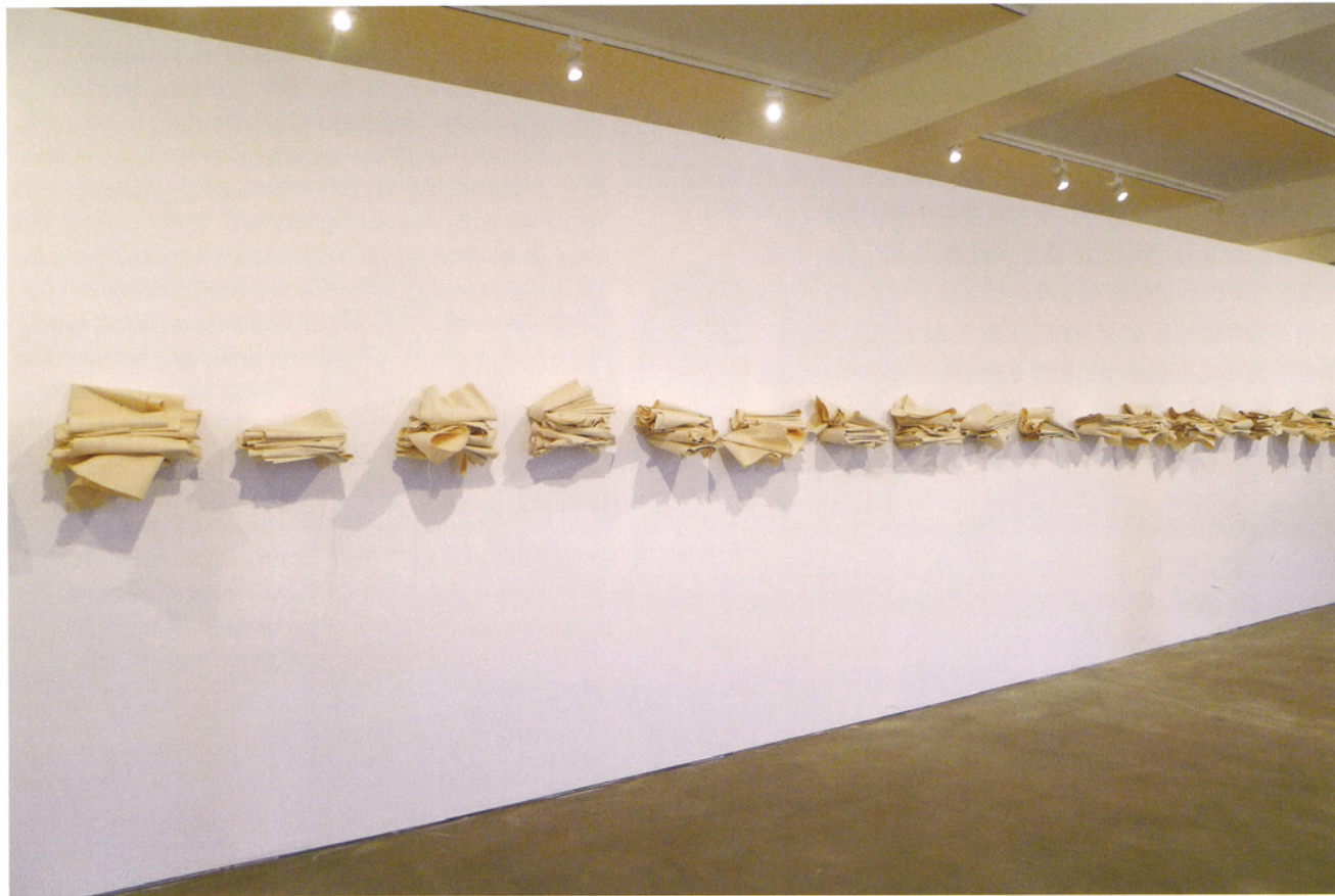
Joël Andrianomearisoa Perfection, the Grave of Our Own Existence installation textile dimensions variable 2013