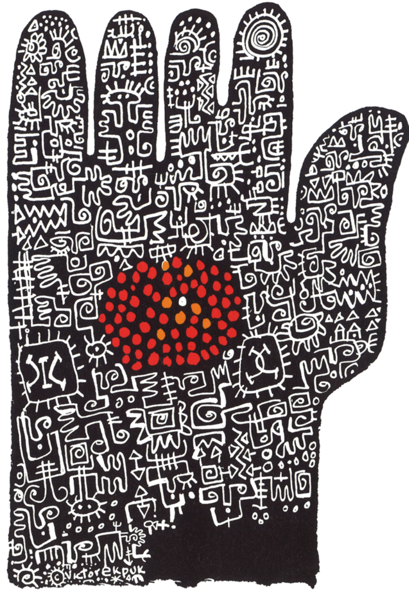
Victor Ekpuk All Fingers Are Not Equal pigment print and acrylic ink on paper 130 × 110cm 2008 © Victor Ekpuk

Joël Andrianomearisoa has participated in important exhibitions at the Studio Museum Harlem, New York; Hayward Gallery, London; Centre Georges Pompidou, Paris; Mori Art Museum, Tokyo; Museum of Art and Design, New York and the Herzliya Museum, Israel, among others.