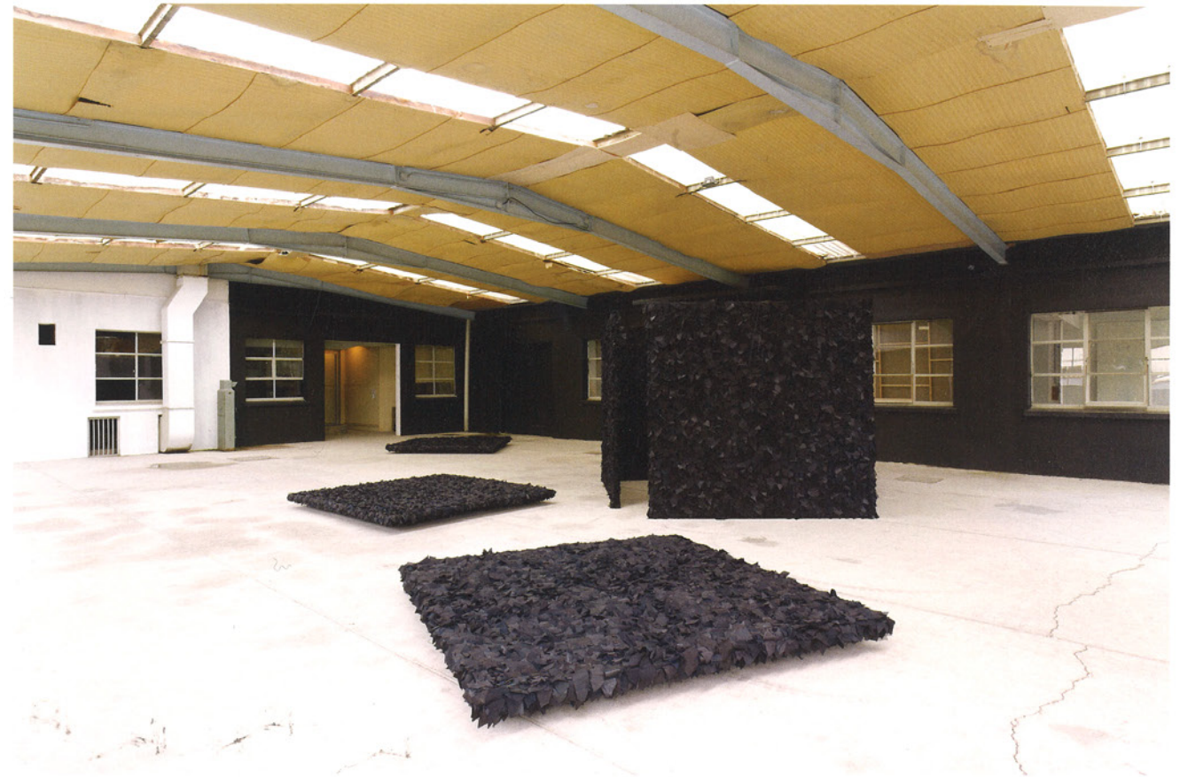
Joël Andrianomearisoa Memory Box installation textile and wood dimensions variable 2007