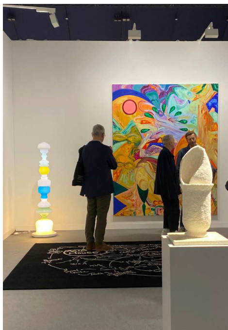
En haut : Paris+ par Art Basel 2023. Vue du stand de la galerie Art : Concept.