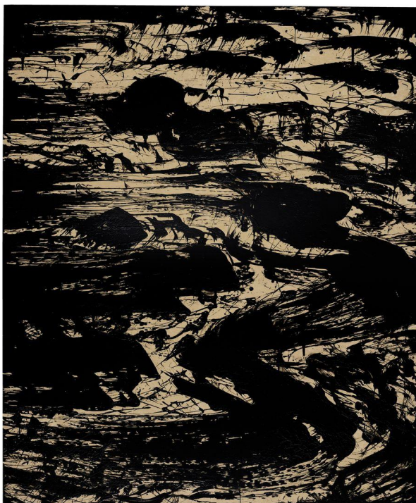
Fabienne Verdier, Rythmes et reflets . Solo III, 2016.

À la Cité de l' architecture et du patrimoine , ce sont 40 peintures abstraites grand format de Fabienne Verdier que le public peut découvrir, à partir du 22 octobre 2025 et jusqu'au 16 février 2026, sous le commissariat de l'historien de l'art Matthieu Poirier . Intitulée Mute , cette série appelle au silence, cher à la peintresse, presque autant que les notions de calme, de transformation et de flux. L'exposition, présentée conjointement par les galeries Lelong (Paris, New York ) et Waddington Custot ( Londres , Dubaï, Paris), se dévoile dans un parcours labyrinthique, en dialogue avec les volumes du musée et ses collections médiévales.